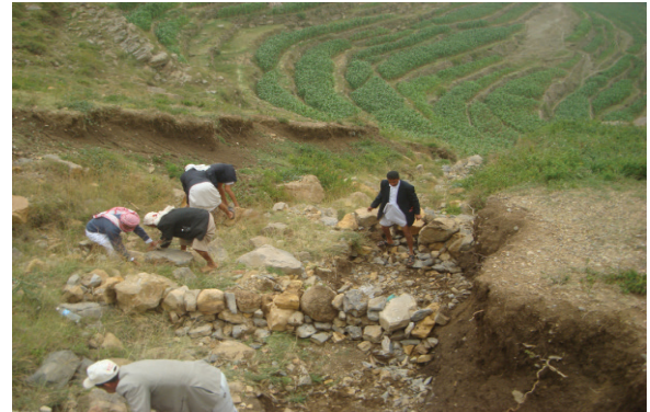
ترميم مسقط مائي في وادي مجبر - المحويت

أما في المسقط المائي في وادي شريم (برع، الحديدة)، فقد تم الانتهاء من تنفيذ أعمال المدرجات التي تقدر بحوالي 14,050 م 2 ، وإنجاز ما يقارب 71% من أعمال بناء 62 خزانا للري التكميلي (من أصل 87) بسعة إجمالية تقريبيّة 4,340 م 3 .