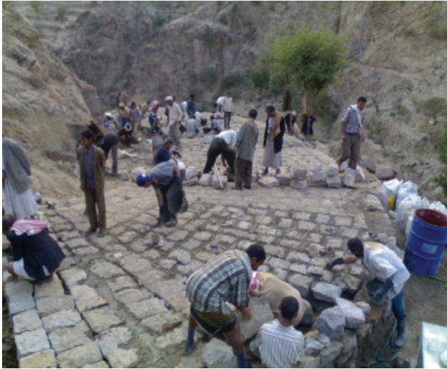
طريق قاعدة بني مسعود-وصاب العالي- ذمار

وفيما يخص المتابعة الميدانية لمشاريع القطاع، فقد تمت زيارة 21 مشروعاً خلال الربع - مؤزعة ما بين مشاريع قيد التنفيذ (للاطلاع على جودة الأعمال المنفذة)، ومشاريع من خطه 2012 (للاطلاع على جوده الاستهداف، ومدى مطابقتها للمعايير المحددة للاستهداف). وبذلك يكون العدد الإجمالي (التراكمي) للمشاريع التي تمت زيارتها 246 مشروعاً