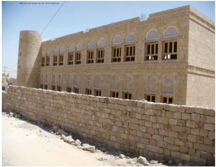
مدرسة قارن- عيال حاتم- جبل يزيد- عمران

وقد توزعت مشاريع الربع على بناء وإعادة تأهيل وتجهيز مدارس في مختلف المحافظات، وترميم عدد من المدارس المتضررة من أحداث العام الماضي، وتزويد مدارس برنامج الجودة التعليمية بالأثاث والتجهيزات التعليمية في 4 محافظات، وبناء وتأثيث وتجهيز عدد من مكاتب التربية والتعليم، ودعم أنشطة ومسارات برنامج المهويين (أكثر من محافظة)، وتدريب الكادر الإداري والأكاديمي لكليات المجتمع (أكثر من محافظة أيضاً) .. بالإضافة إلى دورات تدريبية وورش عمل.