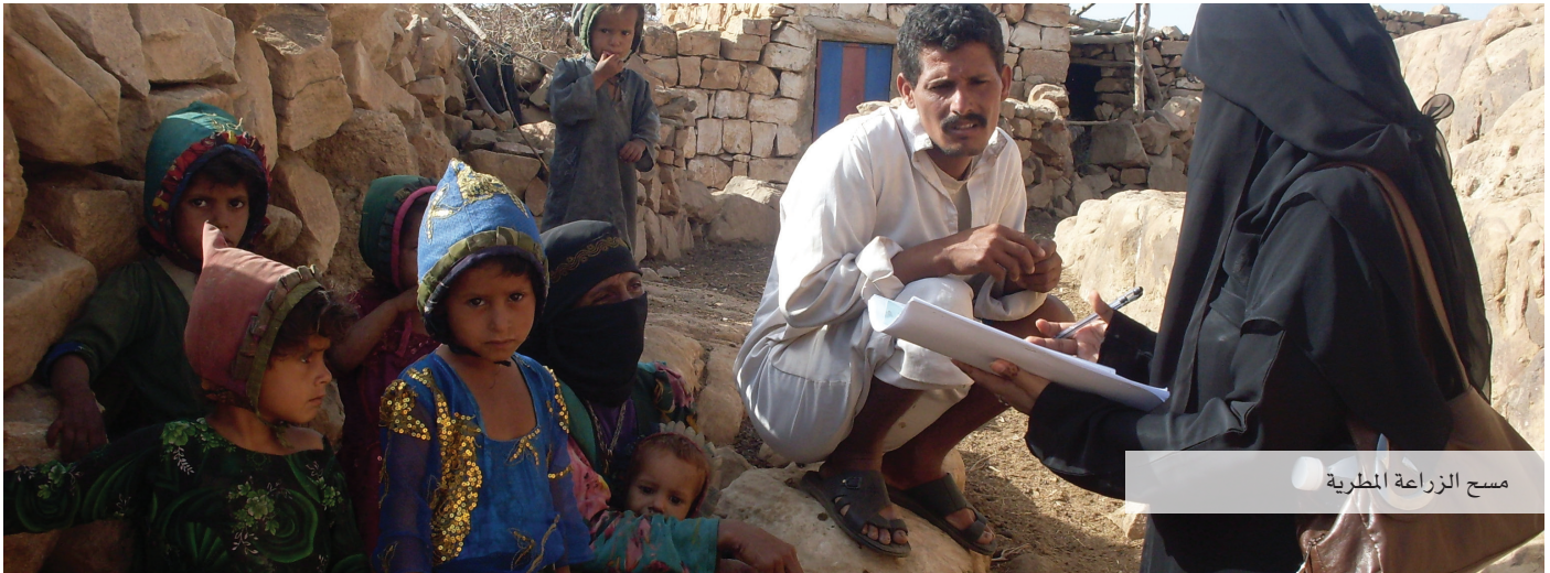
مسح الزراعة المطرية