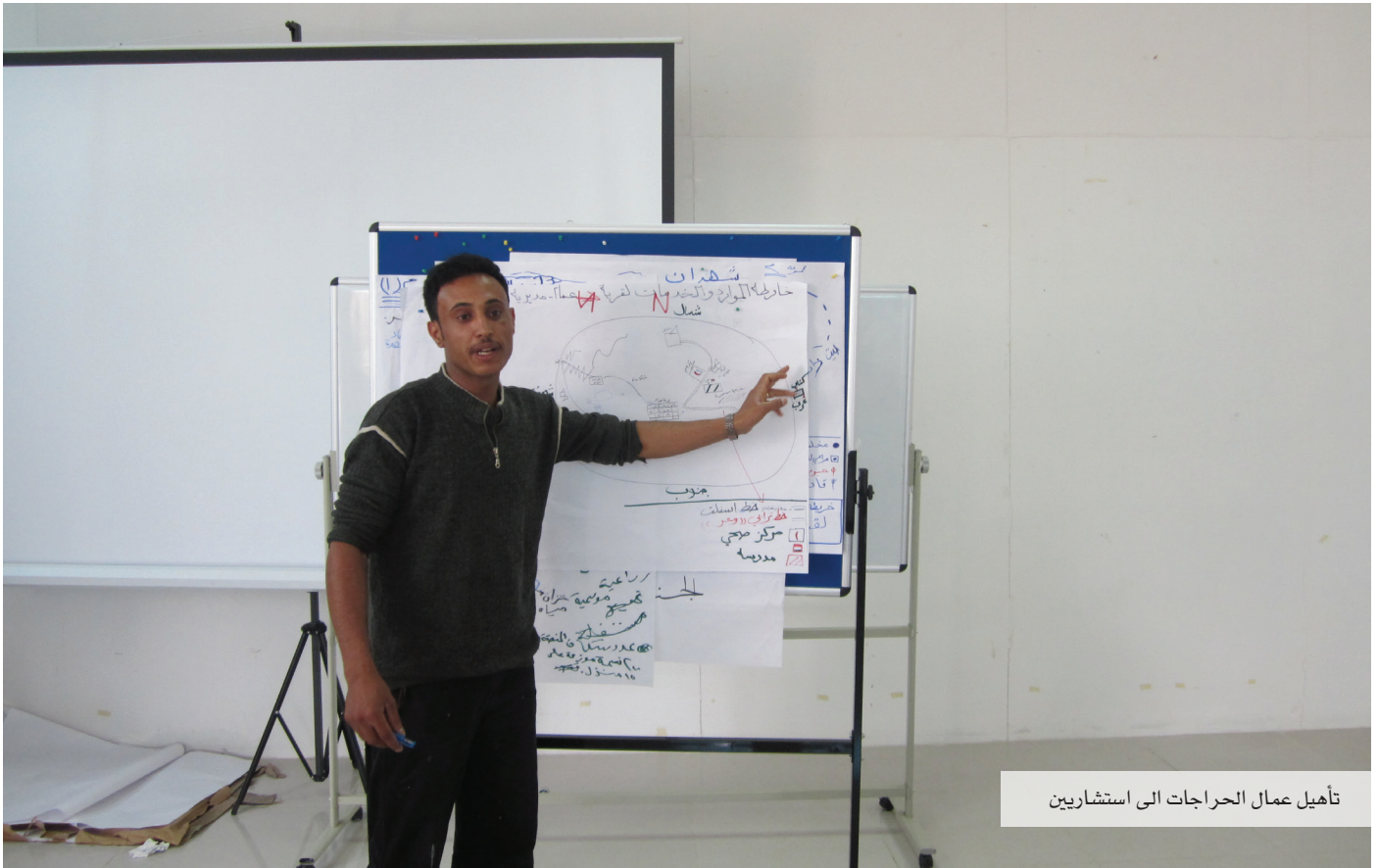
تأهيل عمال الحراجات الى استشاريين

وجرى ايضاً تدريب 180 شخص ( 50% إناث) على صحة الحيوان وتغذية الحيوان في منطقة كرش القبيطة ، الى جانب تنفيذ برنامج المدارس للصحة التجريبي من خلال ( تشكيل وتدريب الفرق المدرسية- تنفيذ عدد من الأنشطة البيئية والصحية- تنفيذ عدد