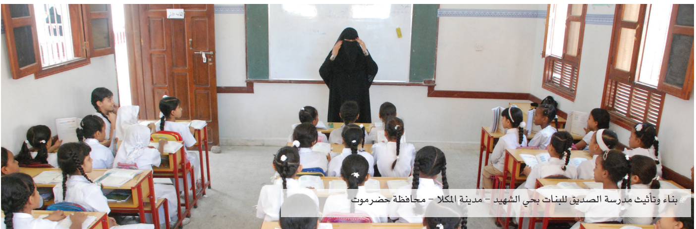
بناء وتأثيث مدرسة الصديق للبنات بحي الشهيد - مدينة المكلا - محافظة حضرموت