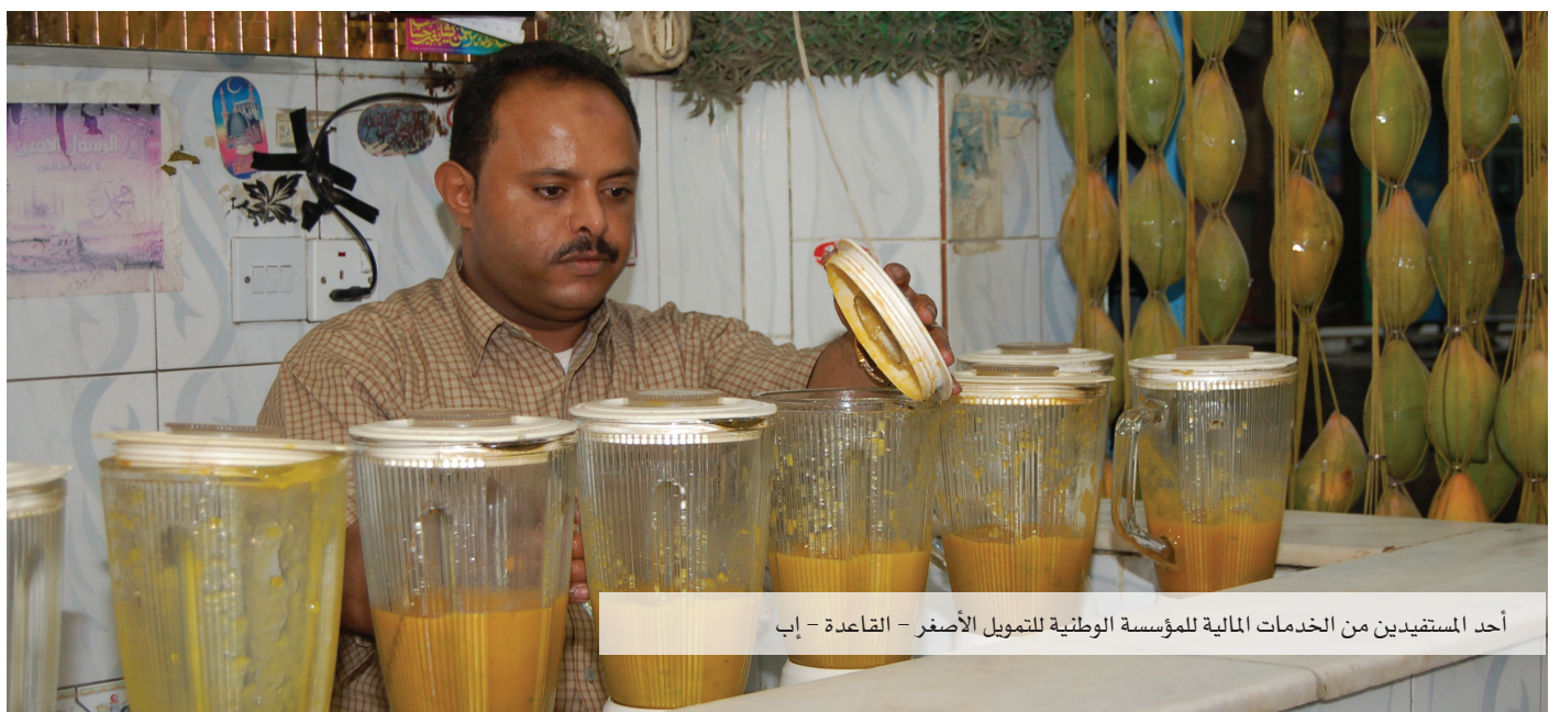
أحد المستفيدين من الخدمات المالية للمؤسسة الوطنية للتمويل الأصغر - القاعدة - إب

تم أعداد الإجراءات المالية لتمويل الوكالة بمبلغ يقارب 64.5 مليون ريال (ما يعادل 300,000 دولاراً) لتنفيذ أنشطتها في المركز الرئيسي وفرعها في عدن والمكلا. وقد قامت الوكالة خلال الربع الأول بتنفيذ عدة أنشطة في مجال خدمات تنمية الأعمال