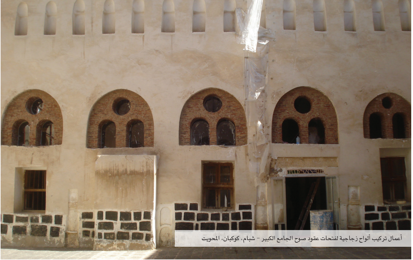
أعمال تركيب ألواح زجاجية لفتحات عقود صوح الجامع الكبير - شبام، كوكبان، المحويت

الاصلي، كما يتم الترميم للعناصر الخشبية المتبقية في شرفات المنارة وتجهيز المفقود منها، وتجدر الإشارة الى أن كل الاعمال يتم تنفيذها بكوادر وطنية تم تدريبها في مشروع ترميم مسجد ومدرسة الاشرافية بتعز ولم تؤثر الحرب على نشاط المشروع حتى تاريخه.