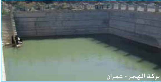
بركة الحجر - عمران

يهدف القطاع إلى توفير المياه المحسنة والكافية للمجتمعات المحلية الفقيرة وفق تعريف التغطية بالمياه المتفق عليه بين كل الجهات العاملة في القطاع، وكذا رفع الوعي الصحي والبيئي للمستفيدين. وقد تم في هذا الربع وضع الترتيبات اللازمة للبدء بتنفيذ البرنامج الخاص لمواجهة شحة المياه في عموم الجمهورية وبمبلغ 100 مليون دولار، حيث نظمت رئاسة الوحدة خلال يومي 27 و 28 مارس 2010 ورشة عمل بالمقر الرئيسي حضرها كل مدراء فروع الصندوق وكذا كافة ضباط المياه والبيئة بالصندوق. وقد تم خلال الورشة استعراض مخصصات مديريات الجمهورية من هذا البرنامج وفقاً لمؤشرات فقر المياه والفقر العام لقرى الجمهورية اليمنية حسب التعداد السكاني لعام 2004م وكذا مسح ميزانية الأسرة لعام 2005م. كما تم خلال الورشة مناقشة وإقرار الخطط التفصيلية لكل فرع لتنفيذ مخصصاتها من البرنامج وبما يضمن تنفيذ البرنامج خلال الأربع السنوات القادمة (2011م – 2014م). وتمت مناقشة وتعديل وإقرار آلية تطوير وتنفيذ مشروعات البرنامج الخاص. كما قام فرع عدن بتنفيذ دورة تدريبية لمدة ستة أيام لتأهيل استشاريين في حصاد مياه الأمطار، حضر الدورة 22 متدرباً تأهل منهم 16 متدرباً.