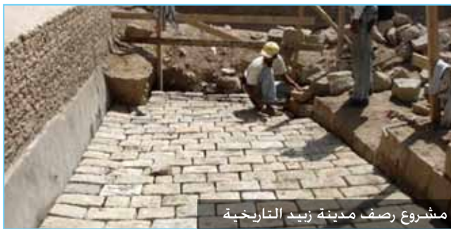
مشروع رصف مدينة زيد التاريخية

تم عقد الورشة الثانية في الإدارة الميدانية والجوانب المالية المتبعة فيها للاستشاريين المحاسبين.