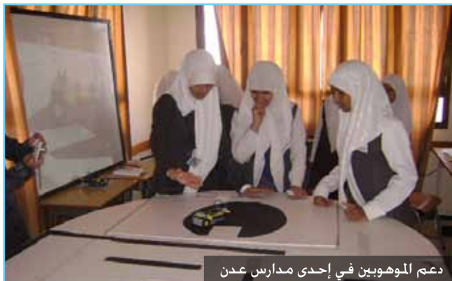
دعم الموهوبين في إحدى مدارس عدن

بلغت مشاريع التعليم الموافق عليها خلال الربع الأول من عام 2010 (125) مشروعاً بتكلفة تقديرية 29.31 مليون دولار. توزعت مشاريع التعليم التي استفاد منها 54.035 شخص بشكل مباشر على البرامج والقطاعات الفرعية. والتعليم الأساسي (105) مشروعاً تلي بعد ذلك دعم سياسات و توجهات تعليمية و تربوية ( 7 ) مشاريع ثم تعليم ما قبل المدرسة ( رياض أطفال )، ( 5 ) مشاريع و نحو الأمية بـ ( 4 ) مشاريع , و توزعت بقية المشاريع على بقية القطاعات الأخرى و بمشروع واحد لكل من الجودة التعليمية و بناء القدرات و التعليم العالي و التعليم غير النظامي.