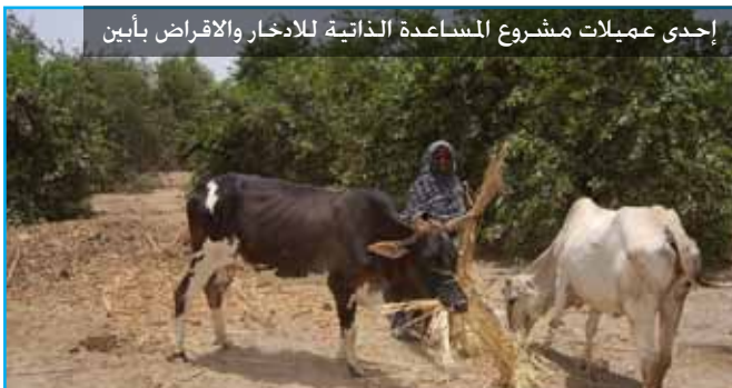
إحدى عمليات مشروع المساعدة الذاتية للائحة والاقراض بأبين

. برنامج طموحي هو أحد مشاريع فرع الوكالة بعن ويهدف إلى تحسين المستوى المعيشي والاقتصادي من خلال بناء قدرات الشباب والمنشآت الصغيرة ومزودي الخدمات وتطوير سلاسل القيمة المحلية في أربع محافظات (عدن – أبين – لحج – الضالع). وقد تم تدريب وتجهيز فريق طموحي تدريباً مكثفاً ليكونوا مؤهلين لتنفيذ أنشطة ومهام البرنامج كما خطط له.