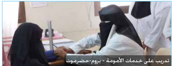
تدريب على خدمات الأمومة - بروم-حضرموت

يهدف هذا المكون إلى زيادة التغطية بخدمات الرعاية الصحية الأولية من