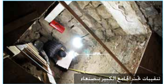
تنقيبات حُت الجامع الكبير بصنعاء

• إنجاز أعمال التمديد الكهربائي لخطوط الكهرباء والحريق. • توثيق مبنى المكتبتين الجنوبيتين تفرغ تحشيبتهما وإعداد تقرير أولى عن رؤية التدخل. وبدأت أعمال الكشف وتقوية المكتشفات الزخرفية والكتابية داخلهما بعدها تمت تكسية جدران إحدى المكتبتين بطبقة جصية مصقولة. • تم تنفيذ معرض عن إنجازات المشروع والجديد فيه واكب زيارة السيد عبد اللطيف الحمد رئيس الصندوق العربي للإنماء الاقتصادي والاجتماعي.