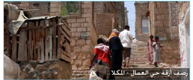
رصف أزقة حي العمال - المكلا

وفي إطار الأنشطة التدريبية في هذا القطاع، تمت الموافقة على مشروع تشكيل وتدريب لجان مجتمعية لمشاريع الطرق المنفذة بآلية التعاقدات المجتمعية يبلغ أعضاؤها 153 مشاركاً، وتصل فرص العمل المؤقتة إلى 153 يوم عمل. وتنفذ القطاع أيضاً 53 مشروعاً تدريبياً بتكلفة تصل إلى 0.8 مليون دولار، بالإضافة إلى ورشة عمل لضباط الطرق في فرع الحديدة بهدف التأهيل استعداداً لدخول المرحلة الرابعة. تم في الورشة تحديد أوجه القصور في المرحلة السابقة وتصور سُبل تلقيها في مشاريع