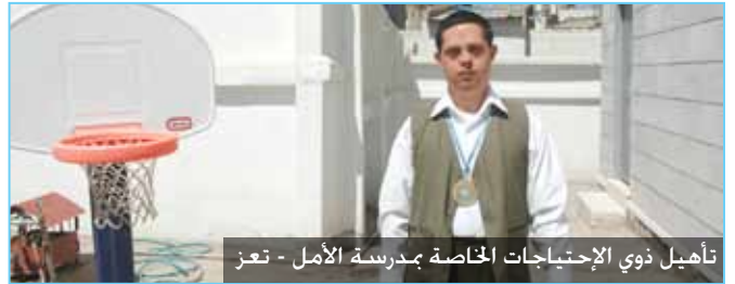
تأهيل ذوي الاحتياجات الخاصة مدرسة الأمل - تعز

وفي إطار هذا البرنامج تم في شهر فبراير تنفيذ دورتين تدريبيتين في صنعاء وتعز هدفنا إلى تدريب 56 معلماً ومعلمة من العاملين في مراكز التربية الخاصة في كيفية تحديد مستوى القدرة البصرية لدى الطلبة من ذوي الضعف البصري وإعداد برامج تعليمية مناسبة للمستوى البصري لكل طفل وكذلك كيفية استخدام المعينات البصرية والعدسات المكبرة. ومن جانب آخر تم تنفيذ دورتين تدريبيتين لـ 18 معلماً ومعلمة من العاملين في غرف المصادر في مدارس التربية الشاملة في أمانة العاصمة ومحافظات أخرى في مجال مبادئ العمل في غرف المصادر ومجال المعالجة وكيفية صنع الوسائل التعليمية واستخدامها في الغرف المصادر