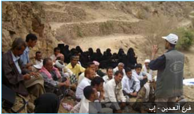
فرع العدين - إب

تم اعتماد مشروعين لتدريب طلبة جامعيين ريفيين لمحافظتي شبوة والمهرة ومحافظة ريمة . وتضمن التدريب بحسب مجالات تشمل مفاهيم وقضايا التنمية ، منهجية البحث السريع بالمشاركة ، تطبيقات الحاسوب .