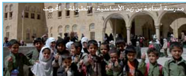
مدرسة أسامة بن زيد الأساسية - الطويلة - الحويط

وشهد الربع كذلك البدء بتدريب المعلمين المختارين للعمل في البرنامج و تأهيلهم لتنمية مهاراتهم في مجال الحاسوب و اللغة الإنجليزية، و إعداد البرنامج التدريبي اللازم لتنمية المهارات في مجال العمل مع الموهوبين. كما يجري الاستعداد لاختيار الفوج الرابع من الطلبة و الطالبات ضمن فصول البرنامج في مدارس البرنامج الأربع المتواجدة في ثلاث مدن مستهدفة و هي الأمانة و تعز و عدن.