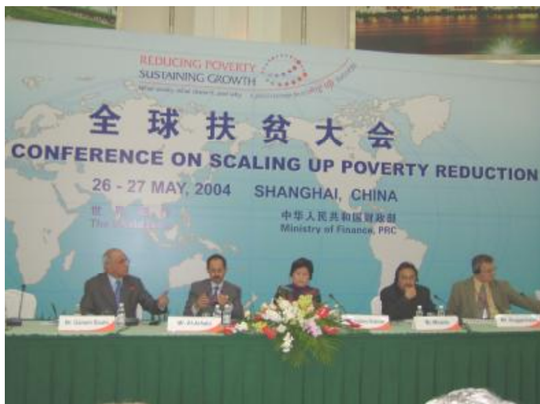
جانب من رؤساء الوفود المشاركة في المؤتمر

وأكد أن اختيار الصندوق الاجتماعي للتنمية ضمن النماذج الريادية العالمية الناجحة، ومناقشة هذه التجربة في مؤتمر عالمي هام حول التنمية، يعتبر بمثابة الشهادة على النقلة النوعية التي حققتها اليمن ومستوى التقدم الذي أحرزته في مجال البناء المؤسسي، وقدرات اليمنيين على تأسيس قواعد لإدارة المؤسسات التنموية بمستوى عالمي يولها لأن تحوز على ثقة وإعجاب الممولين في مجال التنمية في العالم. كما سيعزز ذلك من ثقة الممولين بمؤسسات التنمية اليمنية التي تظهر استيعابها للموارد وقدرتها على استخدام هذه الموارد الاستخدام الأمثل.. مضيفاً: إن مثل هذه الثقة سوف تسهم في الحصول على موارد إضافية لتمويل مشاريع التنمية ومحاربة الفقر.