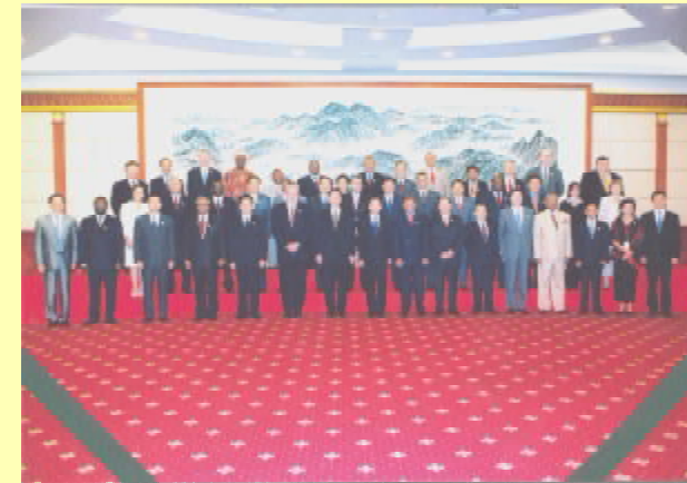
صورة تذكارية تجمع رئيس الوزراء الصيني مع كبار الضيوف المشاركين في المؤتمر العالمي لمكافحة الفقر المنعقد في مدينة "شنغهاي" (الصين)

كما نقدر حرص إذاعيّ صنعاء وعدن (البرنامجين الأول والثاني) وجريدة "يمن تايمز"، على مواكبتها للحدث.