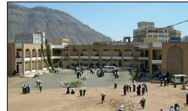
مدرسة 26 سبتمبر، إحدى المدارس التي عُلمت فيها تهيئات لدمج المعاقين

ضمن أنشطة مشروع التدريب والتوعية بمفهوم الطفولة المبكرة، تم إيفاد ستة من العاملين في مجال الطفولة إلى العاصمة القبرصية (لارنكا) في الفترة من 11-17 مارس 2005 لحضور الورشة الإقليمية الخاصة بإغناء خبرات التدريب في الطفولة المبكرة في البلدان العربية، والتي نظمتها "ورشة الموارد العربية" في قبرص. شارك في الورشة ممثلون عن ثمان دول عربية يمثلون جهات حكومية وغير حكومية عاملة في مجال الطفولة المبكرة.